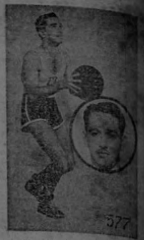
PAGANO Obsequio de la "Tabacalera Costarricense"