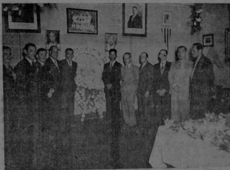
Otro aspecto del festival social-deportivo en la Libertad. Viejos jugadores libertos posando para DEPORTES.