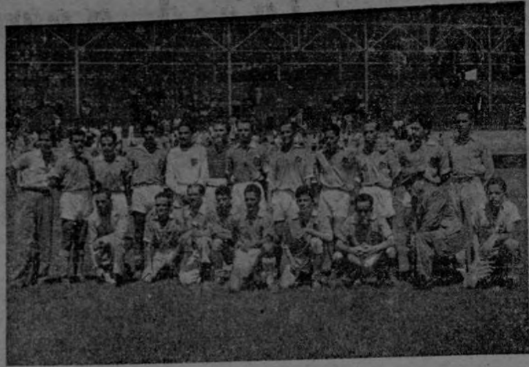
Los sub-campeones 1913. ¿Será más bien los campeones? Lo uno o lo otro lo cierto es que son los ases del fútbol cerebral.