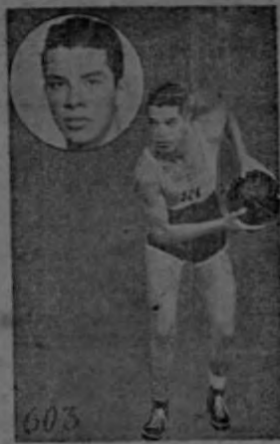
ALVAREZ Obsequio de la "Tabacalera Costarricense"