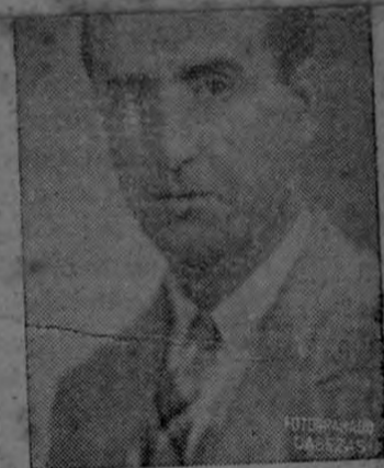
Prof. Jacobo de Foinquinos

La Academia Nacional de Educación Física (Pasa a la pág. 3)